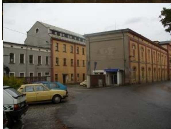
3. Původně továrna na zpracování ovčí vlny - Franz Schmitt, dnes Auto Závod Č. Dub – nevzhledný a okrajově využívaný výrobní areál v centru města