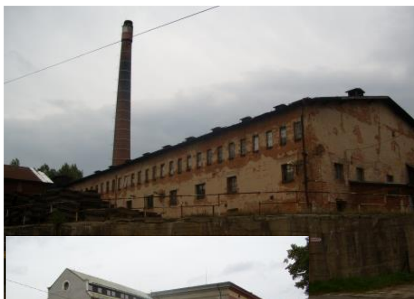
2. Nevyužívaný areál bývalé cihelny - brownfield