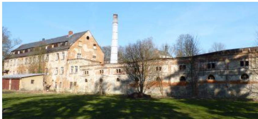
1. Nevyužívaný průmyslový areál Libela - brownfield