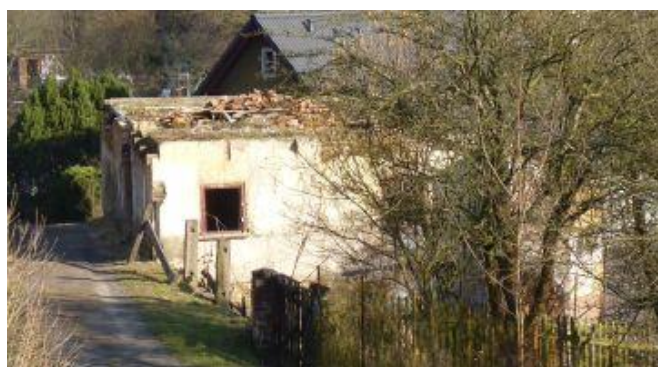
5. Ruina RD u č. p. 131 v Českém Dubu (ul. Řídícího učitele Škody)