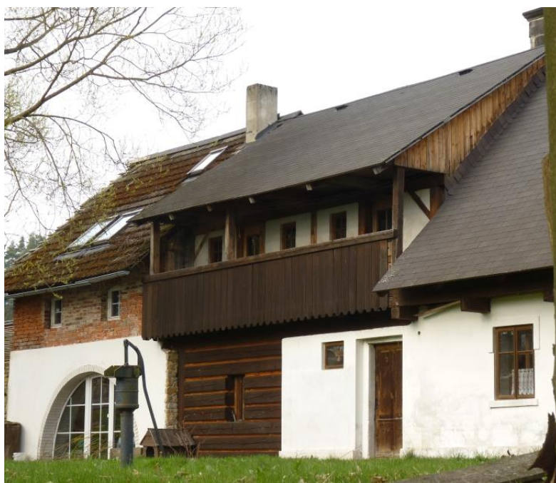
5. nevhodně zrekonstruovaný dům lidové architektury (č. p. 18; nehodící se půlkruhové vstupní dveře)