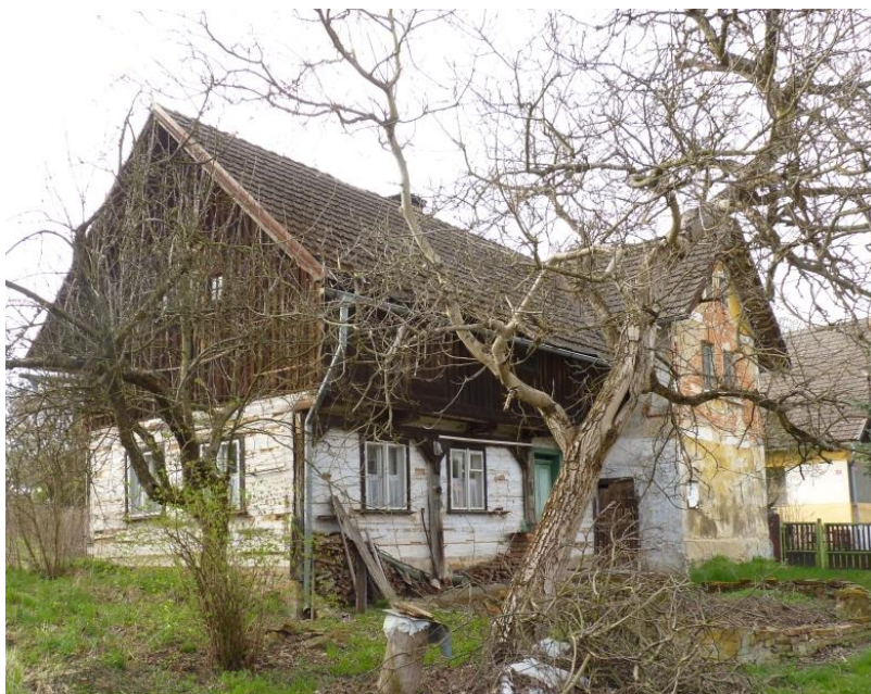
4. Zchátralý poloroubený dům č. p. 8 Hrubý Lesnov