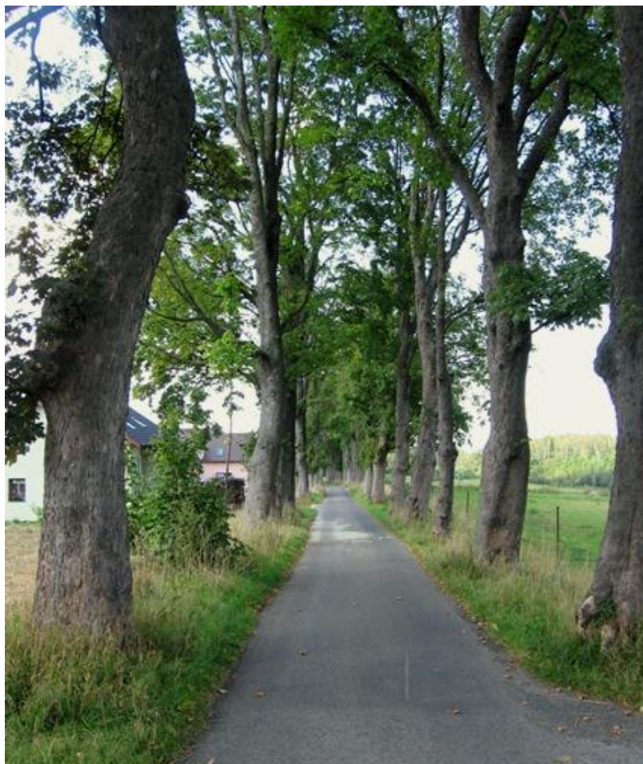
2. Oboustranná císařská javorová alej