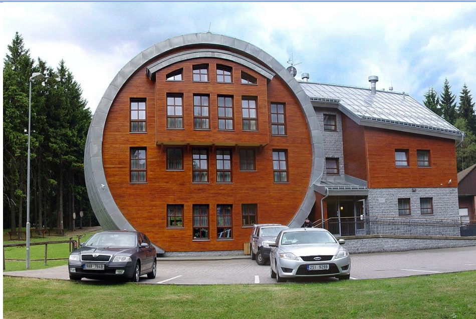
1. Obří sud na Javorníku – penzion, moderní architektura