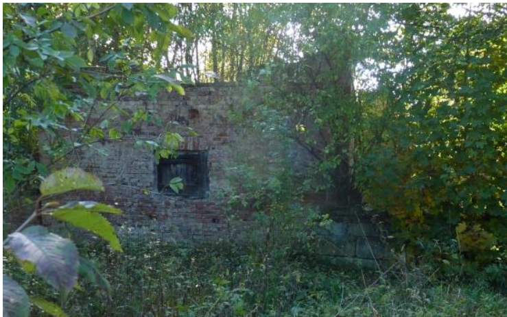
2. torzo hospodářské stavby u domu čp. 59