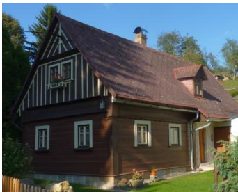
5. Přízemní domek s jednoduchou lomenicí č. p. 51