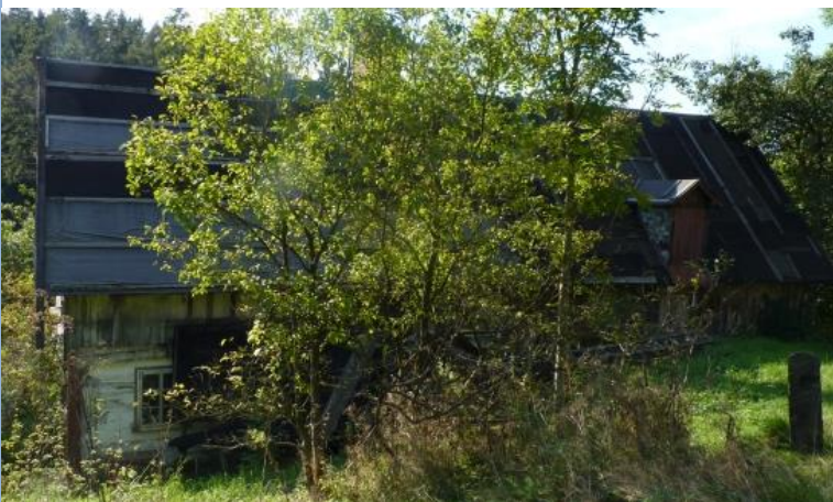
3. Zchátralý a opuštěný poloroubený dům č. p. 25