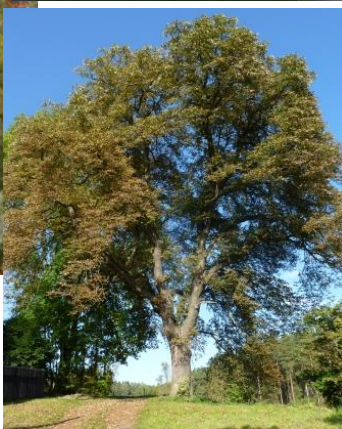
3. Dominantní strom