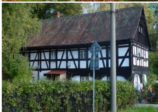
4. Patrový poloroubený dům s podstávkou a hrázděným patrem č. p. 29, kult. památka