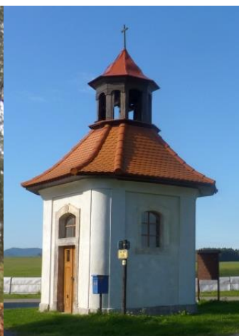
1. Poutní místo Janovické poustevny