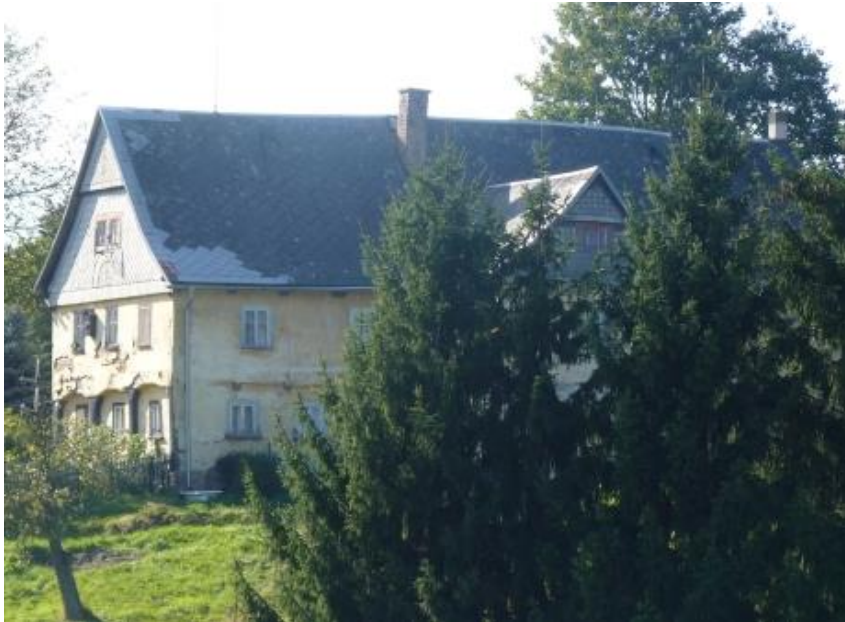
1. Zanedbaný hodnotný patrový dům č. p. 23