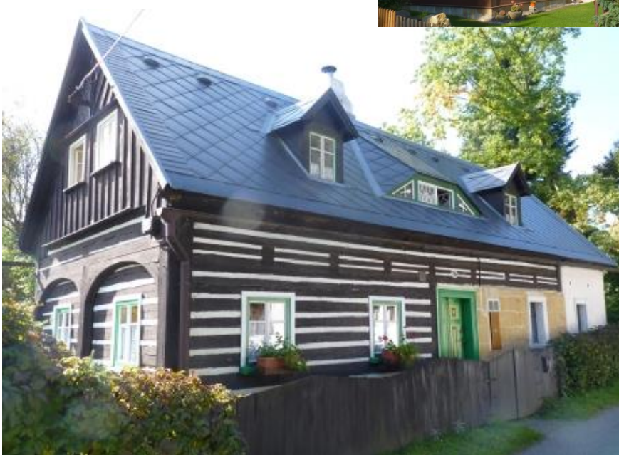
6. Typický přízemní poloroubený dům s podstávkou a sedlovými vikýři č.p. 75, kult. památka