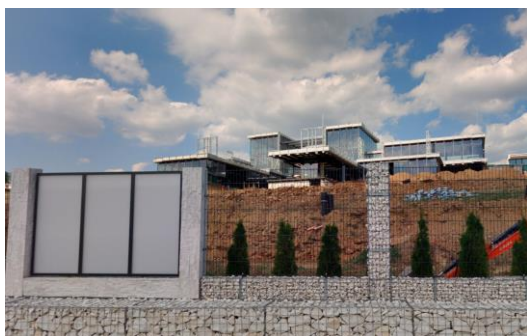
3. nevhodná stavba v rozporu s okolní zástavbou (p.č. 802/67)