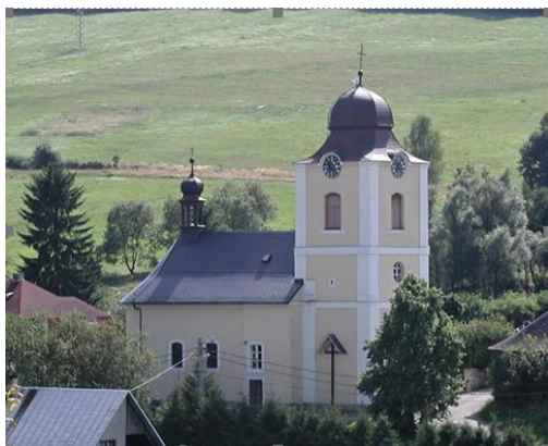
1. Kostel svaté Anny (v centru obce vedle č. p. 4)