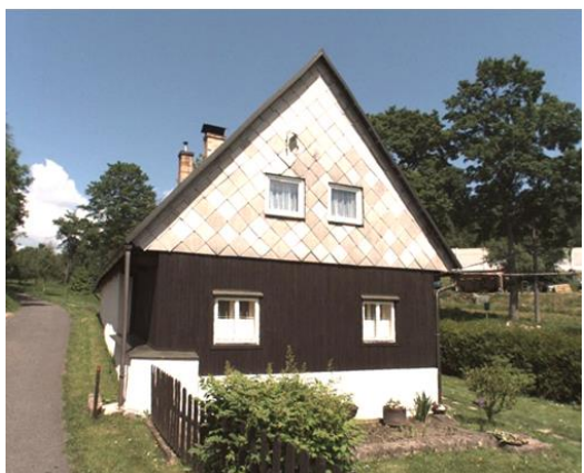
5. Dům lidové architektury (č. p. 195)