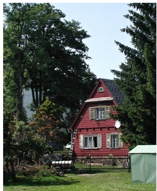
3. Roubená chalupa (č. p. 282)