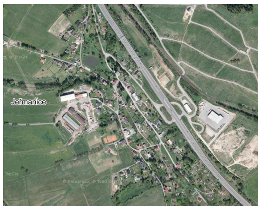
2. fragmentace obce dopravou (silnice I/35 emisní a hluková zátěž)