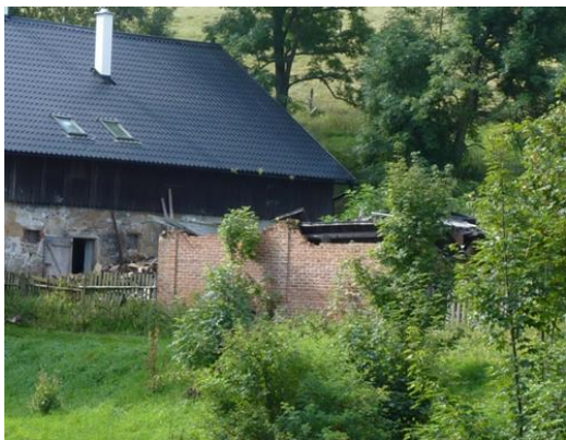
1. zbořeniště v Jeřmanicích