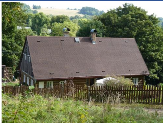
4. Roubená chalupa (č. p. 17)