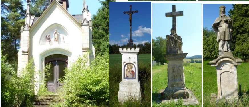
7. Krucifix na podstavci se sv. obrázkem u cesty z Rynoltic do Polesí