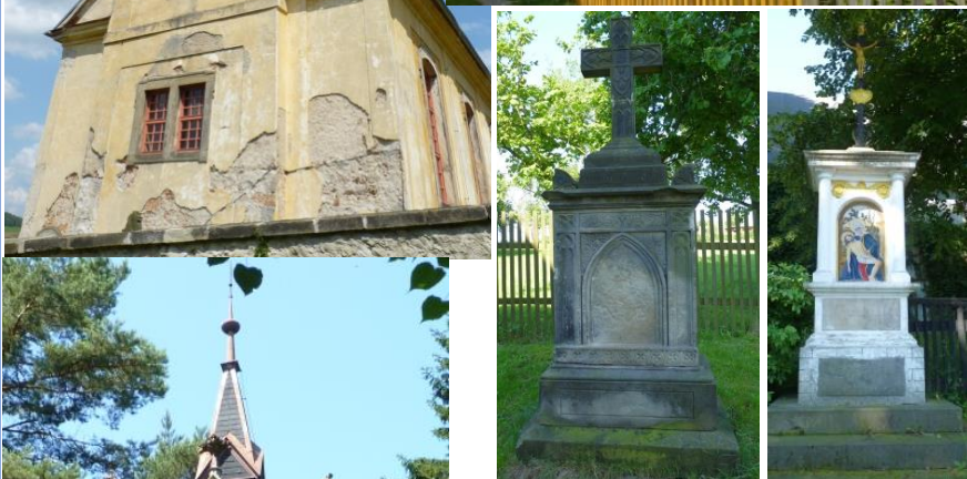
4., 5. Kamenný kříž a železný krucifix na kamenném soklu s obrazem ve výklenku v areálu kostela v Rynolticích