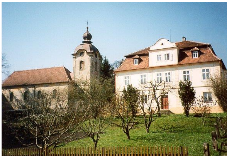
1. Kostel sv. Barbory z druhé poloviny 17. století (k. památka) s farou v Rynolticích