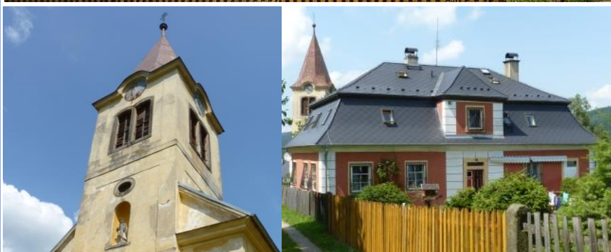
2. Kostel sv. Pankráce z počátku 18. století (k. památka) v Jitřavě