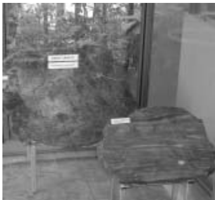
Botanická zahrada jako jediná v republice vlastní unikát, jímž je vybroušený araukarit, který má v průměru 96 centimetrů

Ročně projde branami zahrady na 150 tisíc návštěvníků, kteří se mohou kochat nádhernou flórou. Letos do sbírky přibyl český unikát, s nímž se nesetkají návštěvníci nikde jinde. Je jím zkamenělina araukarit, pravěký strom, který má stejnou anatomii a vnitřní uspořádání jako starobylé jehličnany aurakarie. „ Je to největší vybroušený araukarit nalezený v České republice, v průměru má 96 centimetrů, “ sdělil ředitel Studnička