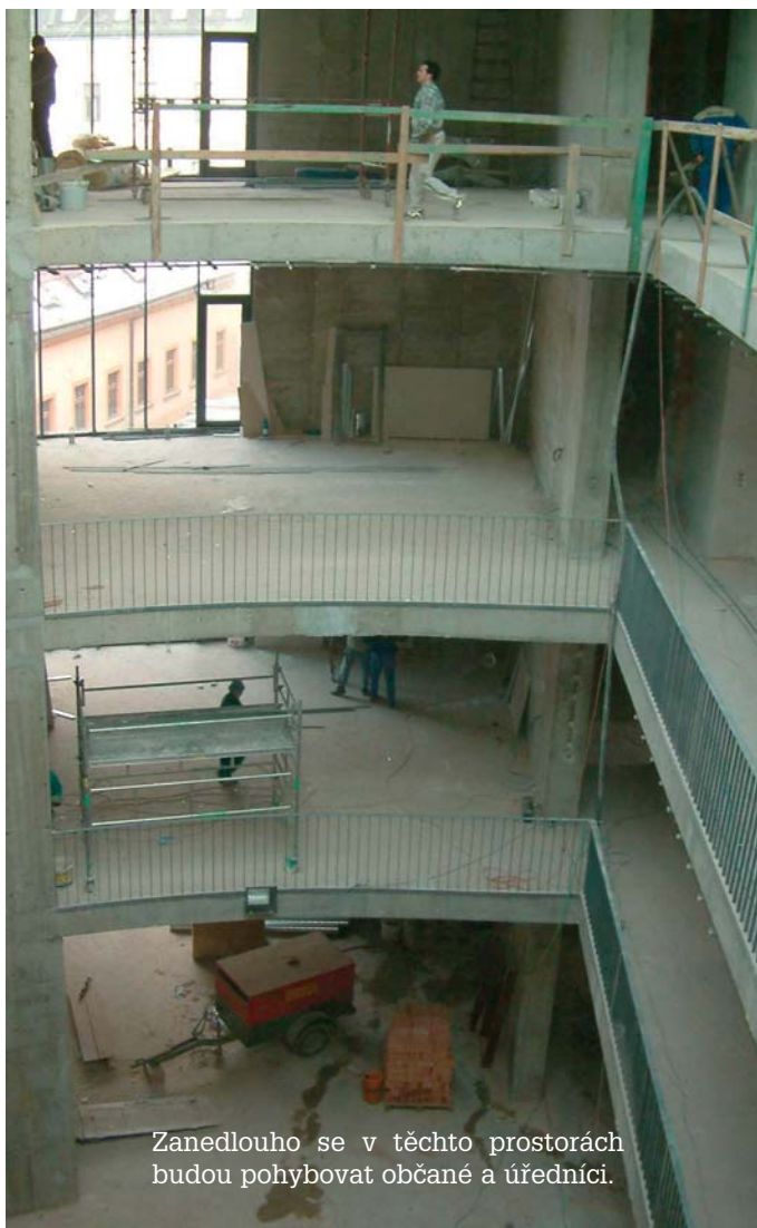
Zanedlouho se v těchto prostorách budou pohybovat občané a úředníci.