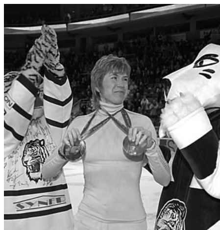
Arna byla prv zastvkou Kateřiny Neumannov v Liberci. Pln fanouk j aplaudovala a dkovala nejen za kovy nejvcennj...

Hlavn s lidmi, kter mm rda. Kdž je k tomu slunko a dobr erven vno, tak jsem spokojen. (saš)