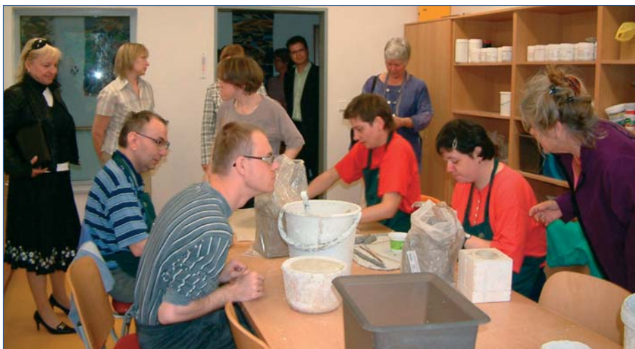
Amersfoortská delegace se seznámila se zázemím harcovského Domova pro mentálně postižené.

DIE NEISSE NISA NYS DER FLUSS, DER UNS VERBINDET ŘEKA, KTERÁ NÁS SPOJUJE RZEKA, KTÓRA NAS LACZY