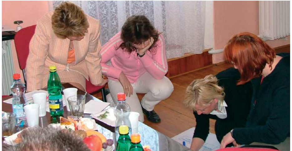
Pracovnice odboru sociálních a zdravotních služeb libereckého magistrátu na školení při práci na dokumentu komunitního plánování.

Činnosti pracovní skupiny pro rodinu, děti a mládež mapuje potřeby občanů z oblasti sociálně-právní ochrany dětí, lidí, kteří potřebují psychosociální pomoc, potřeby tělesně postižených a jejich blízkých, kteří o ně pečují. V pracovní skupině jsou zapojeni poskytovatelé těchto a dalších služeb, jako i organizace, podílející se na pořádání volnočasových aktivit coby prevence patologických jevů ve společnosti a pomáhající rodinám s dětmi v jejich tíživé situaci, jako i organizace zaměřené na podporu zdra-