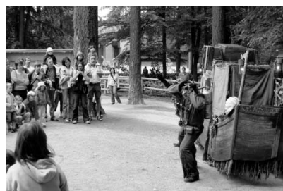
Kanadský soubor Les Sages Fous v ZOO Liberec.

Třídenní liberecké zasedání projednávalo řadu programových bodů, mezi nimiž dominovalo dokončení Světové loutkářské encyklopedie. Výsledek téměř patnáctileté snahy o vznik této mimořád-