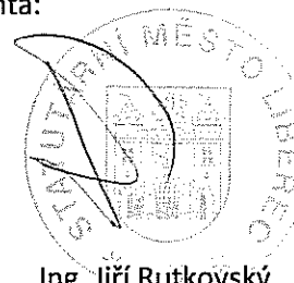
Ing. Jiří Rutkovský náměstek primátorky pro územní plánování, rozvoj města a dotace