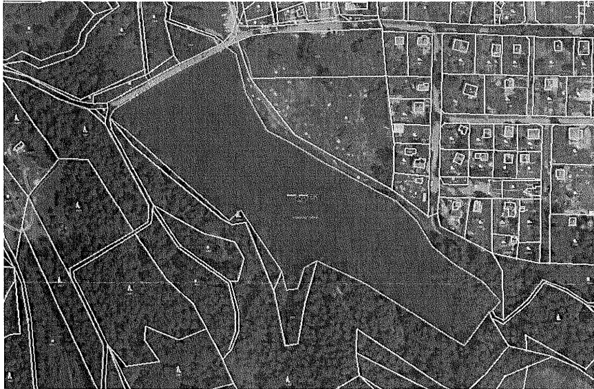
Zátopa vodní nádrže – pozemek p.č. 1934 v k.ú. Vesec u Liberce – vlastník Statutární město Liberec