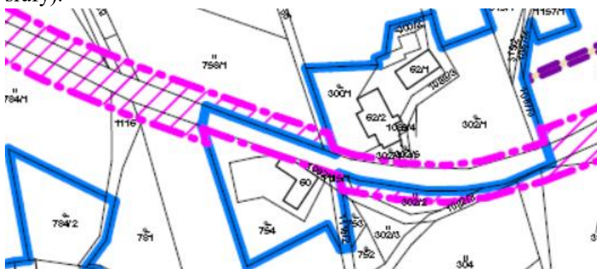
výřez z hlavního výkresu změny č. 1