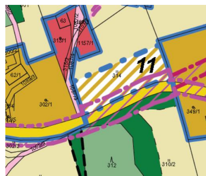
výřez z původního hlavního výkresu úplného znění