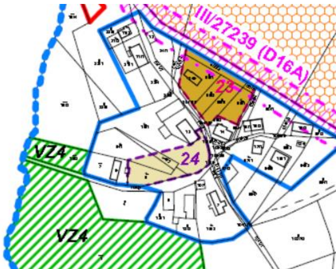
výřez z hlavního výkresu návrhu změny pro veřejné projednání plocha č. 24