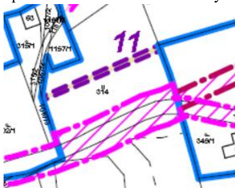
výřez z hlavního výkresu změny č. 1