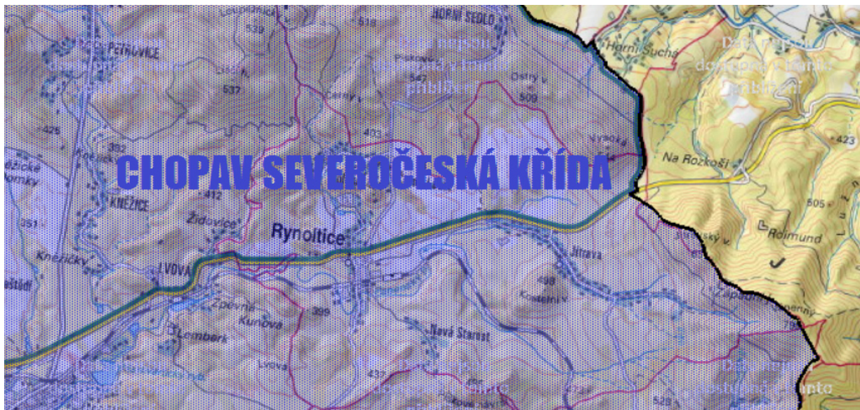
Obr. č. 3: Poloha obce Rynoltice vzhledem k CHOPAV Severočeská křída

hodnocení vlivu koncepce na udržitelný rozvoj území