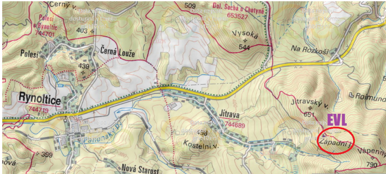
Obr. č. 4: Poloha obce vzhledem k EVL Západní jeskyně

Příčinami rychlého poklesu početnosti je zejména rušení v letních a zimních úkrytech a jejich ubývání a pravděpodobně zvýšená chemizace životního prostředí insekticidy a zřejmě i globální klimatické změny. Ochrana spočívá především v zajištění klidu na zimovištích a místech letních kolonií.