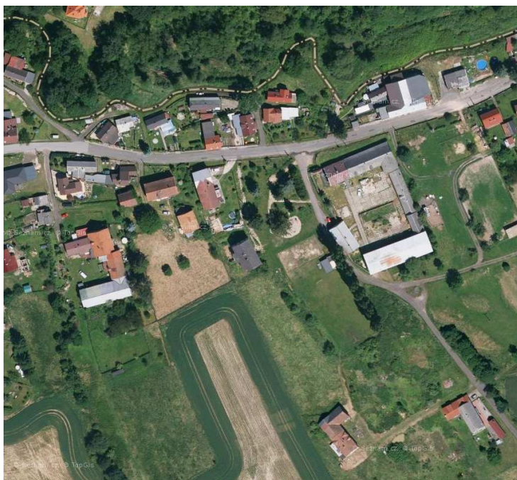
Rozvolněná struktura zástavby uzavřená - smíšená obytná zástavba části Oldřichov na Hranicích