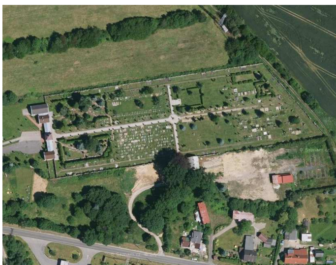
Drobná struktura zástavby solitérní - hřbitov v ul. Liberecká