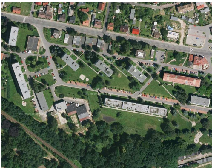
Volná struktura zástavby - panelové sídliště v ul. Liberecká