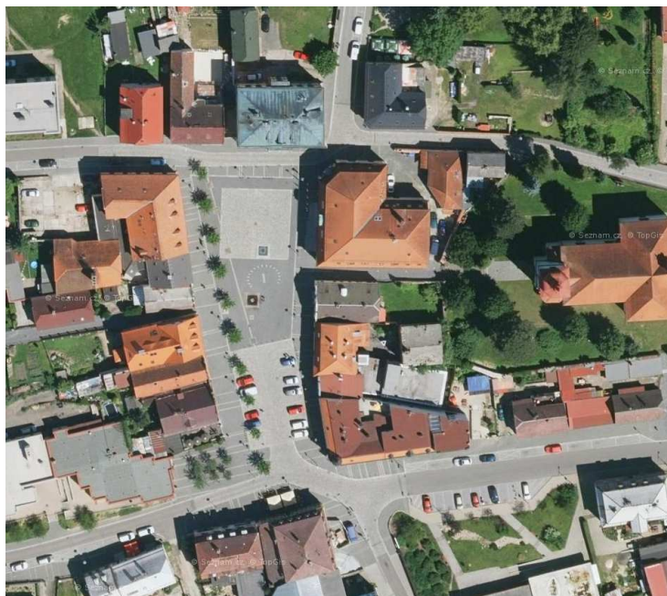
Kompaktní struktura zástavby - historické jádro části Hrádek nad Nisou