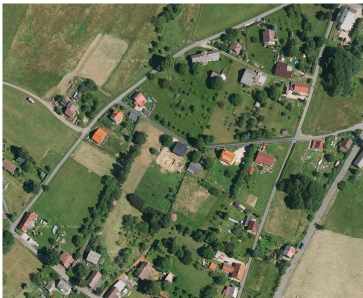
Rozvolněná struktura zástavby – smíšená obytná zástavba části Dolní Sedlo