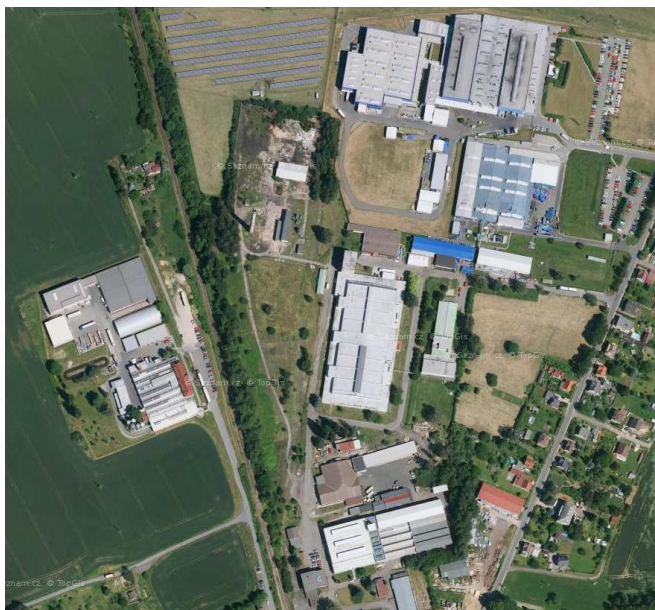
Areálová struktura zástavby - průmyslová zóna Hrádek nad Nisou