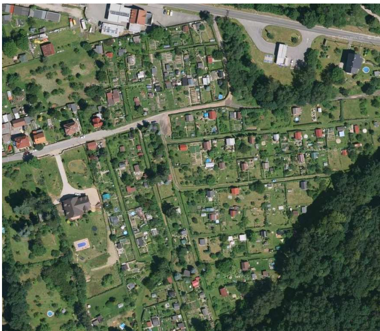
Rozvolněná struktura zástavby drobná - zahrádková osada v ul. Polní (zdroj: mapy.cz)