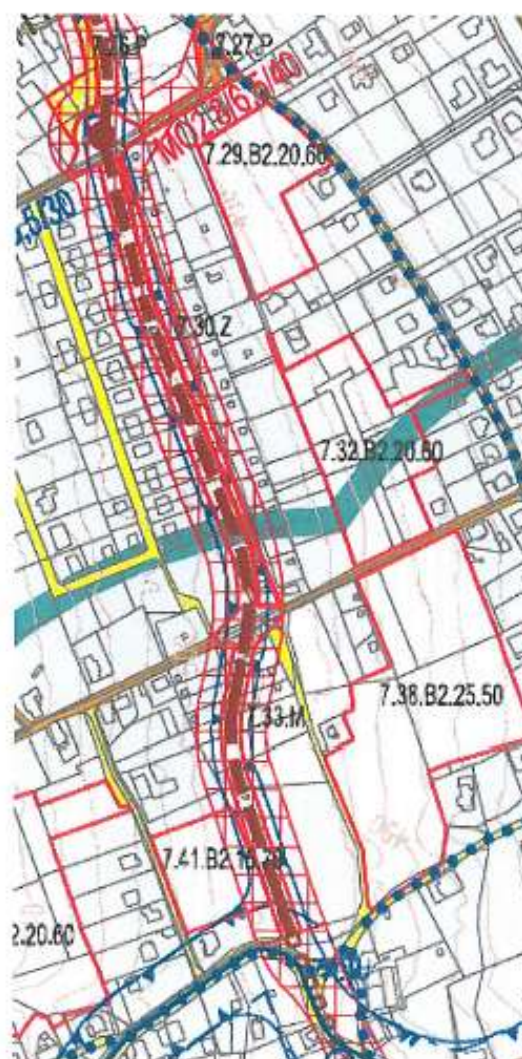
Návrh územního plánu (2013) – Výkres dopravní infrastruktury

Rovněž zahrádky v horním pásu zahrádkářské kolonie jsou daleko více osázeny vzrostlou zelení a je zde umístěno více vybudovaných zahradních chatek. Také toto všechno bude znehodnoceno. Řešení dané lokality, jak je uvedeno v návrhu územního plánu z roku 2013, se