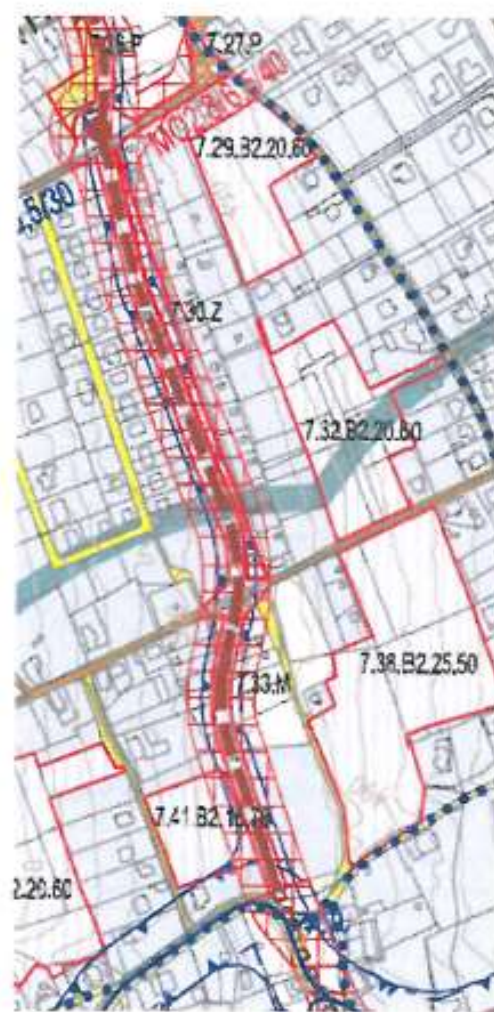
Návrh územního plánu (2013) – Výkres dopravní infrastruktury

Výhody mnou navrhované trasy sběrné obvodové komunikace v lokalitě Horní Hanychov v lokalitě Spáleníště až ulice Sáňkařská – dle konceptu ÚP z roku 07/2010: