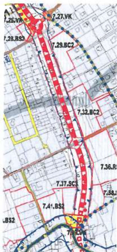
Koncept územního plánu (2010) – Výkres dopravní infrastruktury

Porovnání mnou navrhované trasy umístění sběrné obvodové komunikace (koncept ÚP z roku 07/2010) a nového návrhu ÚP z roku 2013: