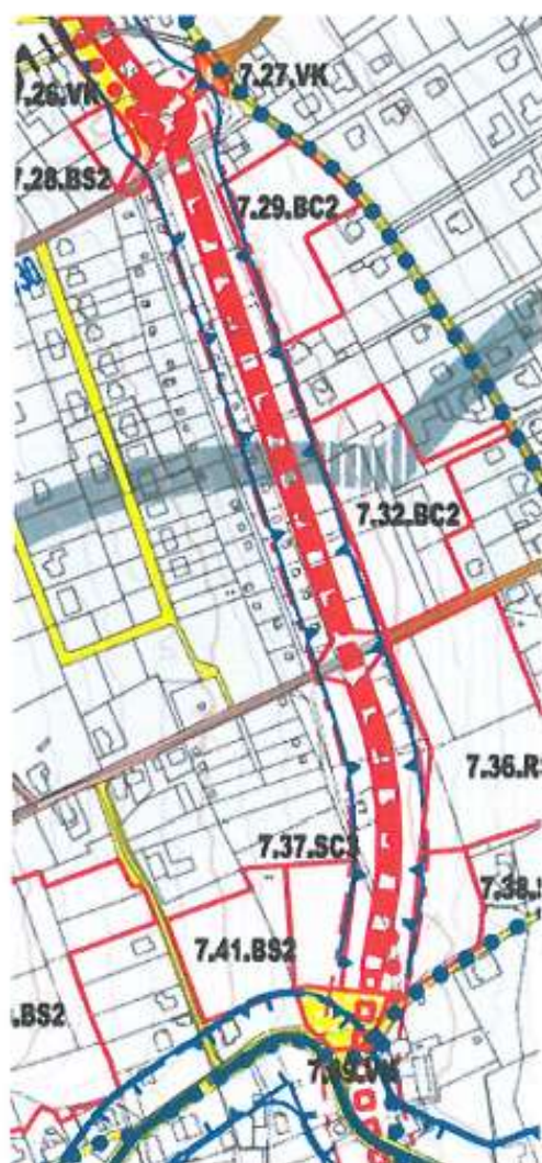
Koncept územního plánu (2011) – Výkres dopravní infrastruktury

Na základě povolení výstavby rodinných domů ve Skokanské ulici, se tato lokalita stala jednou z nejhustěji zastavěných lokalit, v jejíž těsné blízkosti je v aktuálním návrhu územního plánu z roku 2013 vedena sběrná komunikace. Zatímco ve variantě konceptu územního plánu z roku 2011 je komunikace vedena v těsné blízkosti jen několika jednotlivých domů – dle náhledu do katastrální mapy přiloženého k této námitce se jedná konkrétně o 3 domy (respektive jejich trvale obydlené zahrady) a ostatní plochu tvoří louky, tak ve variantě návrhu územního plánu z roku 2013 je komunikace vedena v těsné blízkosti 20 rodinných domů (respektive jejich trvale obydlených zahrad) ze Skokanské ulice (viz porovnání dvou výřezů výkresů uvedených níže a náhled do katastrální mapy uvedený v příloze námitky).