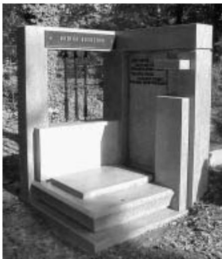
Snímky jasně dokumentují původní stav před opravou hrobky a po opravě