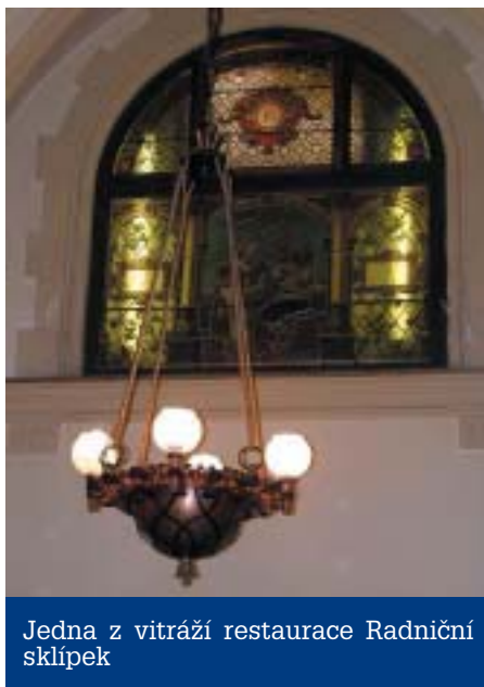
Jedna z vitráží restaurace Radniční sklípek

du přeměníme v zasedací sál městského zastupitelstva, který pak může být využíván i pro jiná zasedání. Přilehlé salonky využijí zastupitelské kluby. Výhodou nového řešení sálu pro zastu-