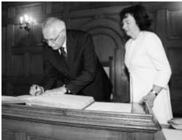
Prezidentský pár se zapsal do pamětní knihy města

„Vy to zvládnete,“ odpověděl na to prezident. „Jen aby to zvládlo počasí. Být vámi, tak bych si připravoval ještě tratě v Krkonoších.“ Primátor ale kontroval, že kvůli ekologické zátěži není možné rozšířit například běžecké tratě na Bedřichově a FIS by jim to ani