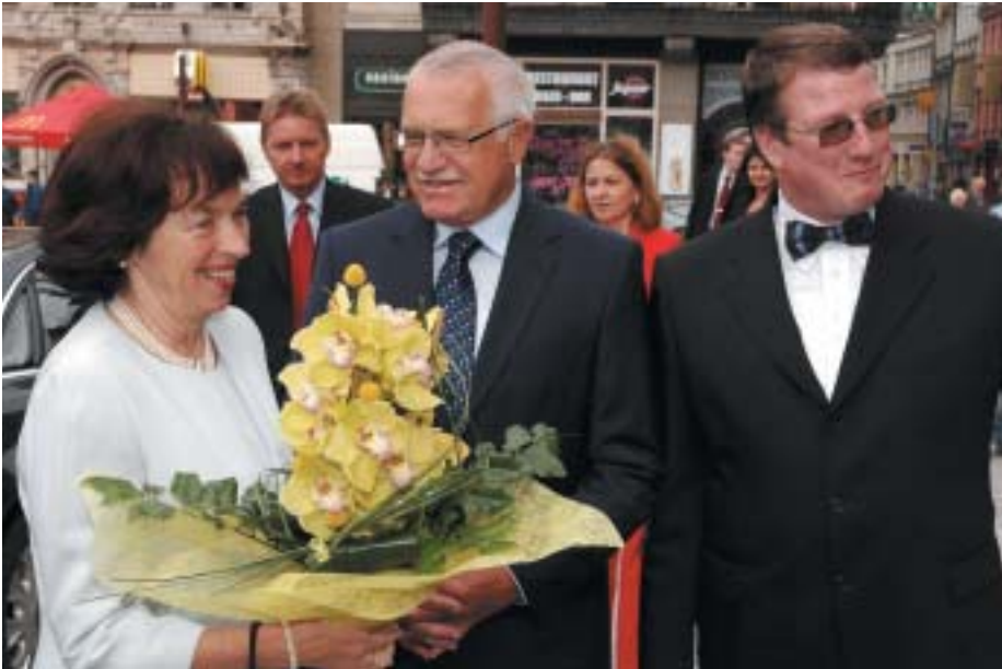
Prezidentský pár přivítal před radnicí primátor města Jiří Kittner