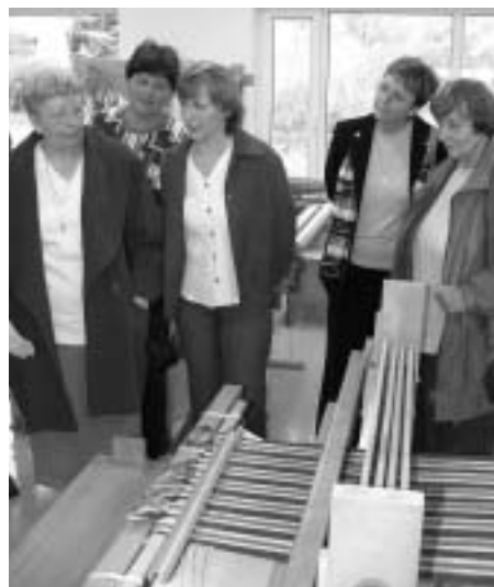
Jedním z pracovišť je tkalcovská dílna, kde na ručních stavech vznikají originální výrobky