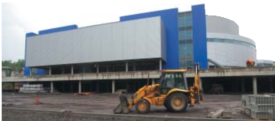
Okolí Areny Liberec se každým dnem mění. Stavaři totiž zahájili úpravu přístupových cest k Areně a také parkovacích ploch, které pojmou v první fázi kolem tisíce automobilů

Prázdniny budou patřit v Areně filmařům, kteří zde budou natáčet nový český seriál ze zákulisí hokeje. „Tuto dobu využijeme hlavně na zprovoznění ostatních sportovišť, jako jsou bowling, střelnice, gymnastické a aerobní sály,“ prozradil ředitel jednoho z nejmodernějších sportovních a kulturních komplexů v Čechách. (lp)