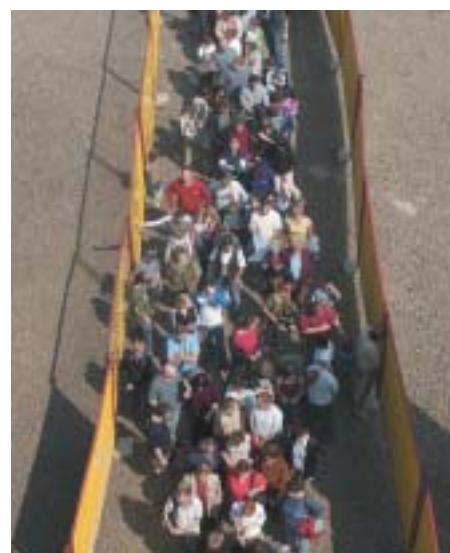
V prvomájový den si přišlo prohlédnout Arenu Liberec přes 8 000 lidí

První opravdová zatěžkávací zkouška Arenu čeká 24. června, kdy se v ní uskuteční koncert pro děti ze základních a středních škol. O čtyři dny později v hale vystoupí slovenská skupina Team. (lp)