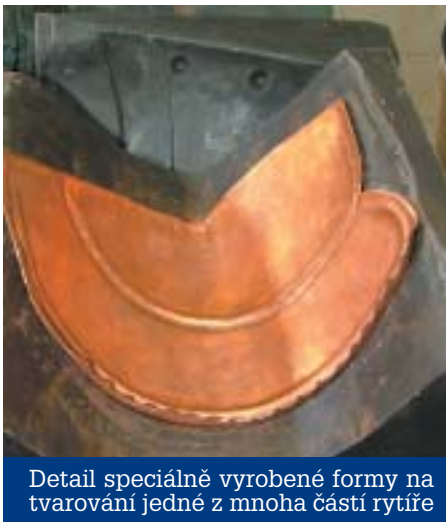
Detail speciálně vyrobené formy na tvarování jedné z mnoha částí rytíře

poloviny srpna. Vyvrcholením prací bude instalace 2,2 metru vysoké repliky rytíře, který se na věž vrátí po 53 letech, neboť byl v roce 1952 nahrazen pěticípou hvězdou a ta v roce 1990 českým lvem. Původní rytíř, který byl obdobou plastiky vídeňské radnice, byl vztyčen na věž 22. září 1891. Podle návrhu Franze Neumanna a modelu zhotoveného profesorem liberecké průmyslové školy Emanuele