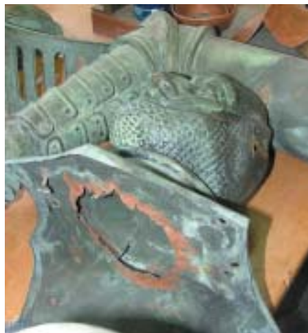
Zkorodovaná část hlavy původní sochy rytíře