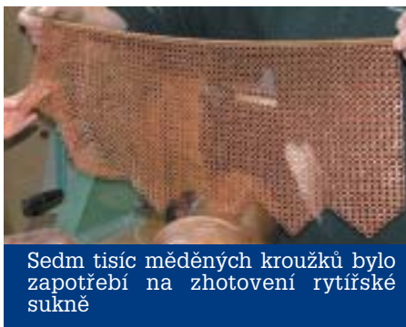
Seдем tisíc měděných kroužků bylo zapotřebí na zhotovení rytířské sukne