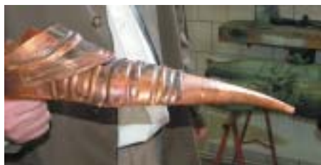
Kdo by řekl, že obuv rytíře půjde s dnešním módním trendem

Od prosince roku 2003 zajišťuje technický odbor magistrátu rekonstrukci radniční věže. Generálním dodavatelem prací je společnost Patrny Architekt, v. o. s. V loňském roce byly opraveny a vyměněny zkorodované kovové prvky, což pro řemeslníky nebyla snad-