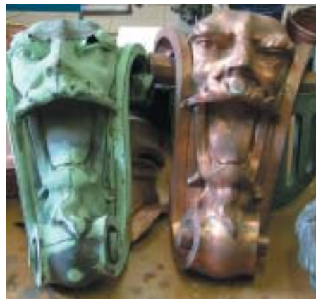
Součástí prací je i výroba tzv. maskaronů, které slouží pro odtok dešťové vody

Kvůli instalaci rytíře bylo zapotřebí vyrobit silnou konstrukci, jakousi páteř, k níž bude replika přimontována. Tohoto úkolu se zhostil jablonecký umělecký kovář Jan Nikendey. Z odlehčené nerezo-