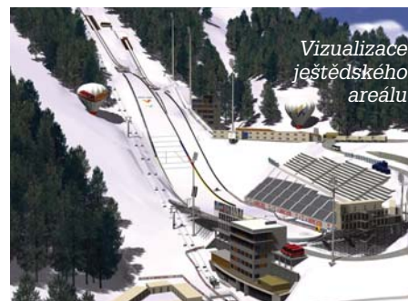
Vizualizace ještědského areálu

letošního podzimu. „Začne se zde s terénními úpravami plochy stadionu a výstavbou jednotlivých lyžařských okruhů, rozvodů vody i systémů na umělé zasněžování, musí se také rozvést elektroinstalace. Poté přijde na řadu nová přístupová komunikace a také provozní budova,“ vysvětluje Jiří Kittner, liberecký primátor a viceprezident organizačního výboru Liberec 2009.