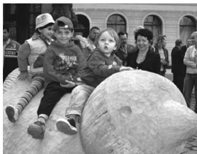
Vrabčí rodinka z dubového dřeva zdobí náměstí před libereckou radnicí od 30. září. Nejvíce si ji oblíbily děti.