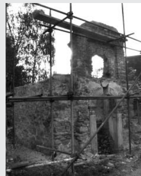
▼ Současný stav

do konce roku střecha s věží, obnoví se fasáda, která bude sladěna s vedle stojící a loni zrekonstruovanou historickou hasičárnou, vyměněny by měly být i dveře. Poněkud polozapomenuté, ale půvabné pilínkovské návsi tak bude navrácen jeden z jejích tradičních klenotů.