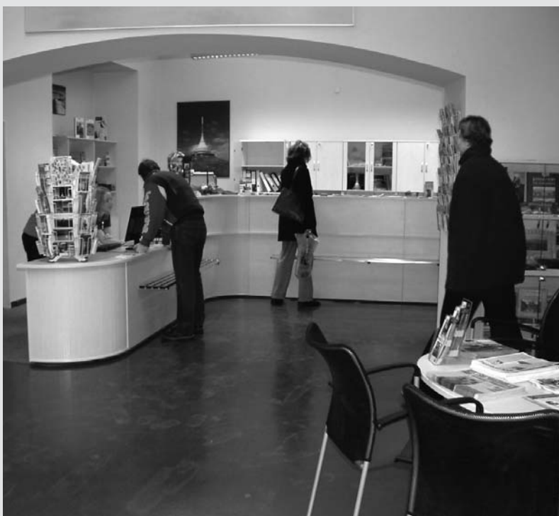
Se zcela novými prostory se setkají návštěvníci Městského informačního centra Liberec, které od pondělí 18. prosince 2006 sídlí opět v budově bývalého Díla. O provozní době centra se dočtete na straně 11.