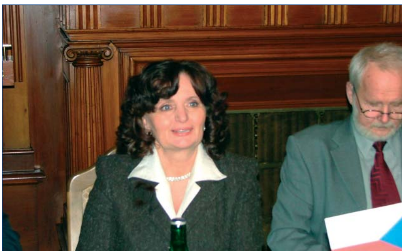
Ministryně školství Miroslava Kopicová při jednání na liberecké radnici.