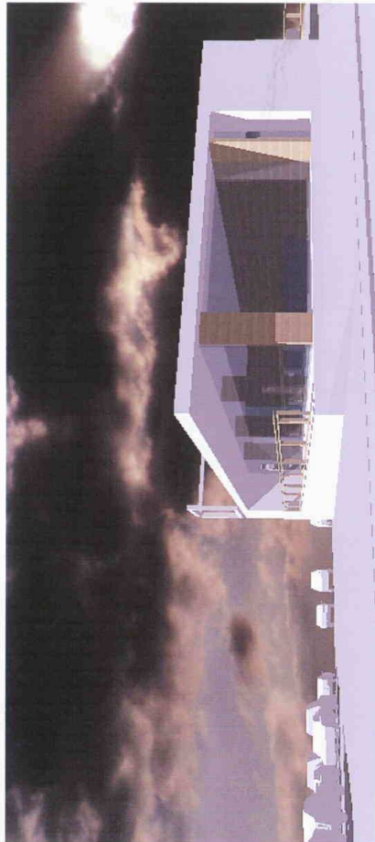
POHLED OD JIHOZÁPADU