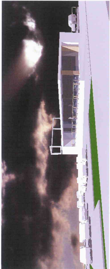
POHLED OD JIHOZÁPADU