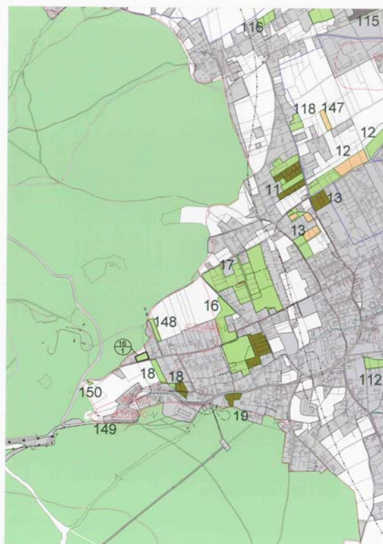
Výkres č. 12 - Vyhodnocení záboru ZPF ( 1 : 10 000 ), vč. legendy