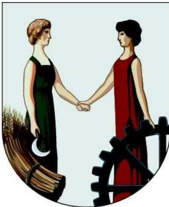
Znak MO Liberec - Vratislavice nad Nisou