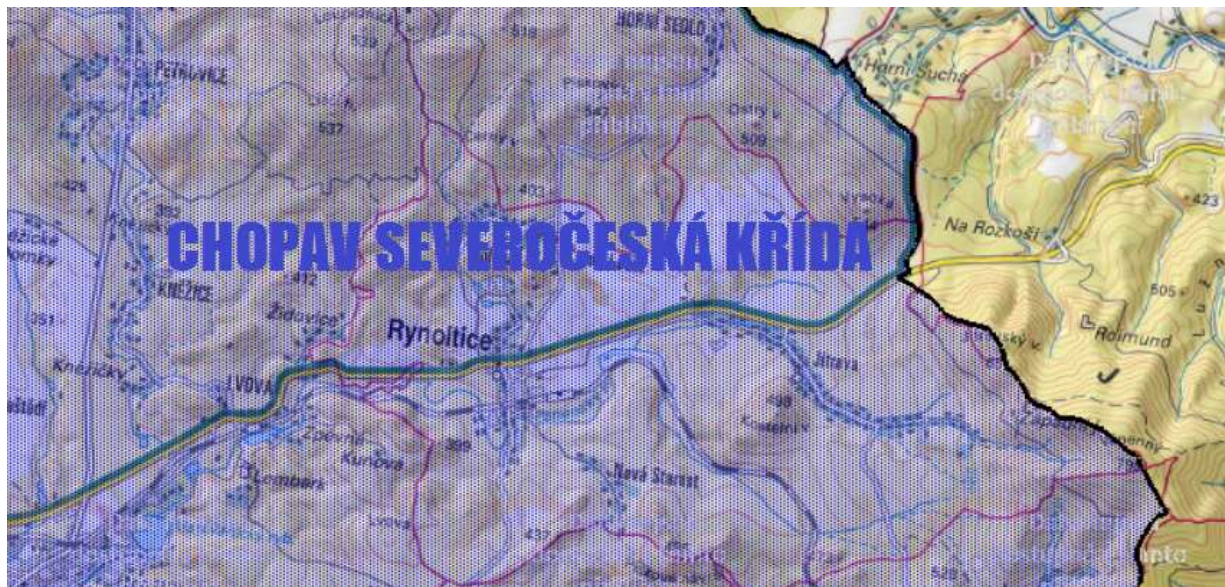
Obr. č. 3: Poloha obce Rynoltice vzhledem k CHOPAV Severočeská křída

Zájmové území se nachází v Chráněné oblasti přirozené akumulace vod (CHOPAV) Severočeská křída. Významným aspektem jsou bohaté zdroje podzemních vod. Převážná část je vázána na kolektory svrchnokřídových sedimentů.