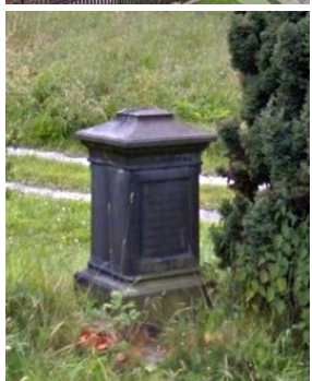
6. Kamenný sokl v Minkovické ul. u domu čp. 14