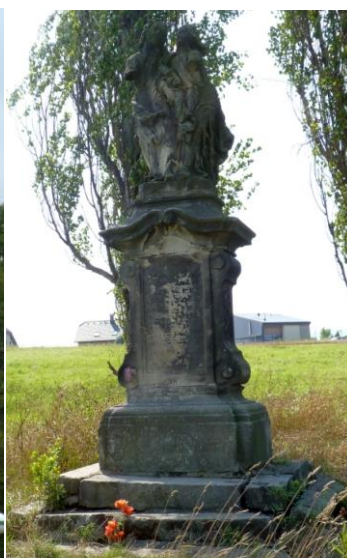
1. Kostel sv. Kateřiny, barokně přestavěn 1727 -28, kulturní památka