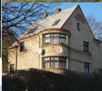
3. Prvorepubliková „německá“ vila. U kina č. p. 321