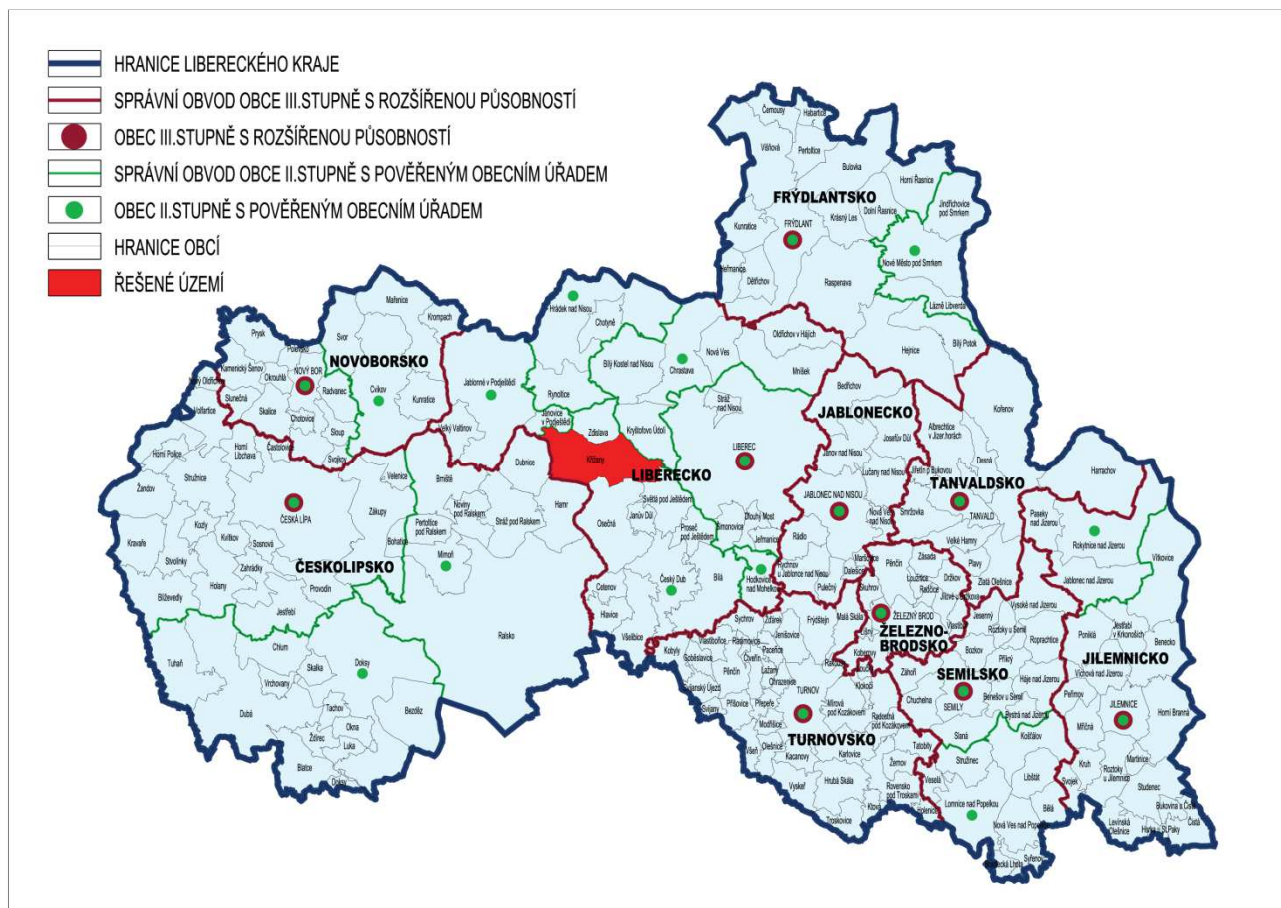
Obr.1 Poloha a postavení obce Křižany v rámci Libereckého kraje

Severovýchodní hranice obce je tvořena zalesněným Strážským kopcem (476 m n.m.), dále Ještědským hřbetem (Křižanského sedlo - Malý Ještěd 754 m n.m. – Dánské kameny). Východní okraj tvoří zalesněné svahy Ještědu (1012 m n.m.). Na jihu pak severními svahy Holubníku (562 m n.m.), Zlaté Výšiny (420 m n.m.). Útěchovického Špičáku (500 m n.m.) a na západě Stříbrným vrchem (432 m n.m.).