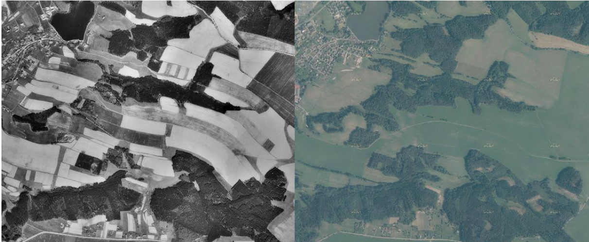
Obrázek č. 1: Rozdíl v diferenciaci kultur v Jablonném v Podještědí mezi 50. lety a současností

Krajina je v územním plánu členěna na plochy s rozdílným způsobem využití vyjmenované v kapitole 10.1.4.