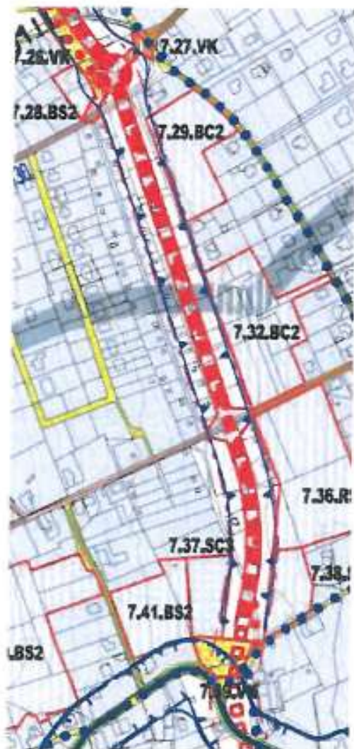
Koncept územního plánu (2010) – Výkres dopravní infrastruktury

Porovnání námi navrhované trasy umístění sběrné obvodové komunikace (koncept ÚP z roku 07/2010) a nového návrhu ÚP z roku 2013: