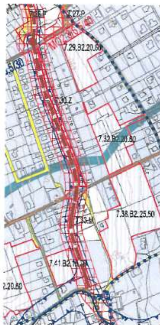
Návrh územního plánu (2013) – Výkres dopravní infrastruktury

Dále uvádíme výhody námi navrhované trasy sběrné obvodové komunikace v lokalitě Horní Hanychov v lokalitě Spáleníště až ulice Sáňkařská – dle konceptu ÚP z roku 07/2010: