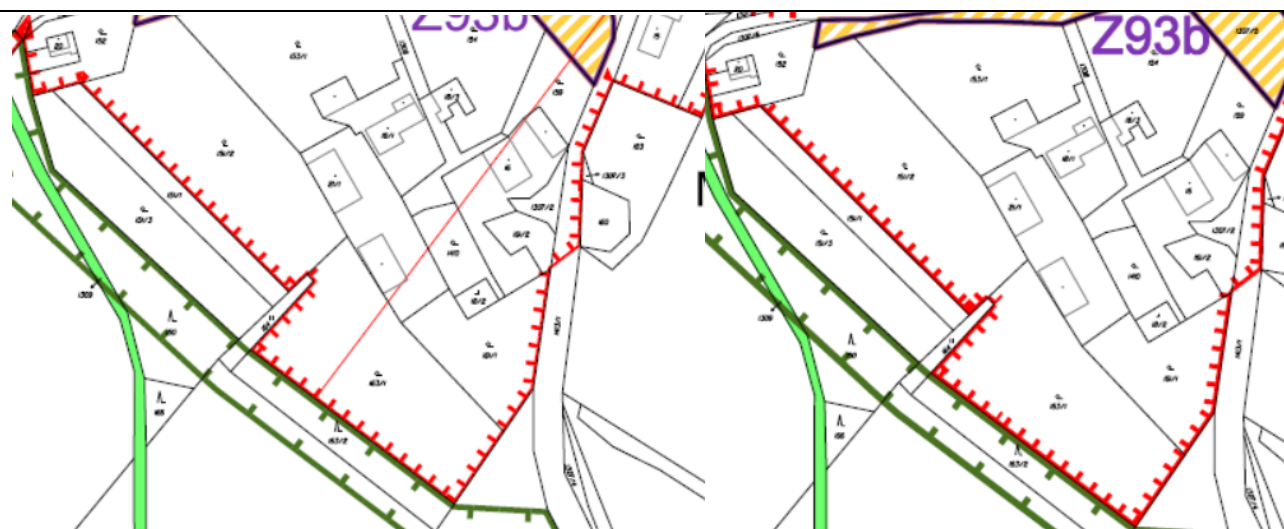
výřez z nového návrhu pro SP