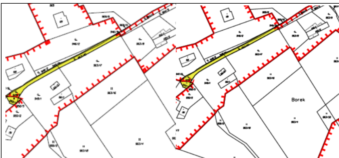
výřez z nového návrhu pro SP