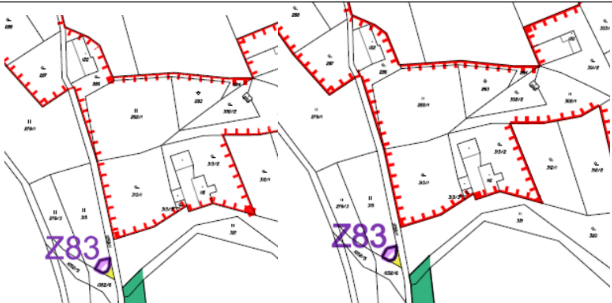
výřez z nového návrhu pro SP