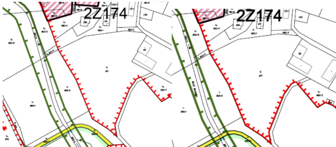
výřez z nového návrhu pro SP

Zastavěné území vymezené na pozemku parc. č. 977 v k. ú. Všelibice bylo v novém návrhu pro veřejné projednání vymezeno ve stejném rozsahu jako v novém návrhu pro společné jednání. Nejedná se tedy o měněnou část. V souladu s ustanovením § 52 odst. (3) stavebního zákona nelze tento požadavek zohlednit, protože dotčené orgány mohou uplatnit stanovisko pouze k měněným částem.