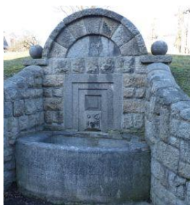
2. Kašna na „nádvoří“ Starého zámku