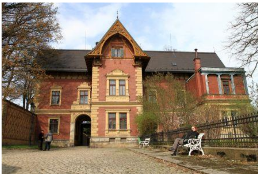
1. Neorenesanční Blaschkova vila, kulturní památka