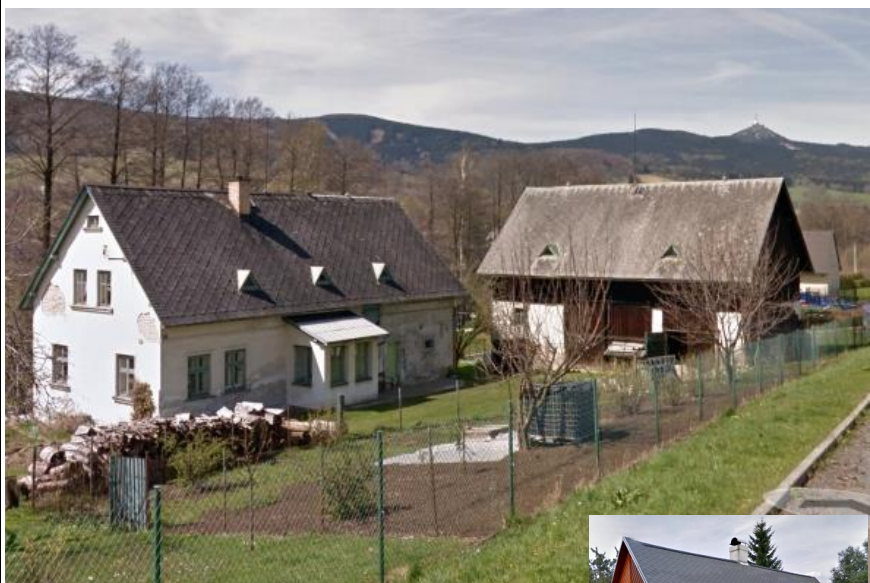
3. Původní zástavba Minkovic, zděný dům se stodolou Buková ul. čp. 72