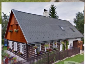
4. Poloroubený dům s lomenicí v Šimonovicích, Šimonovická č. e. 41