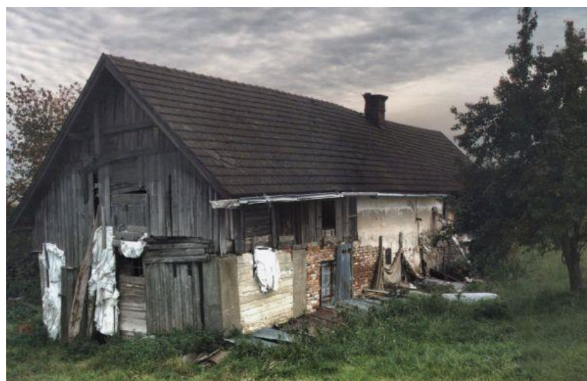
3. Opuštěný a zdevastovaný dům č. p. 22 Hrubý Lesnov