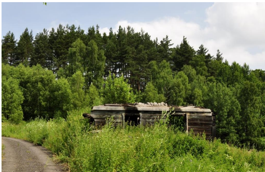
1. Vyhořelý dům v Těšnově (č. p. 14)