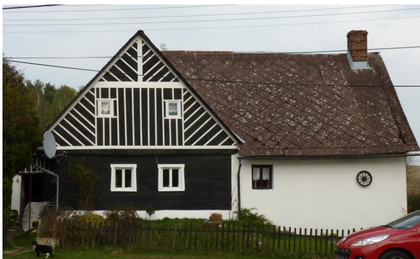
8. poloroubený dům lidové architektury v Hrubém Lesnově (č. p. 28)