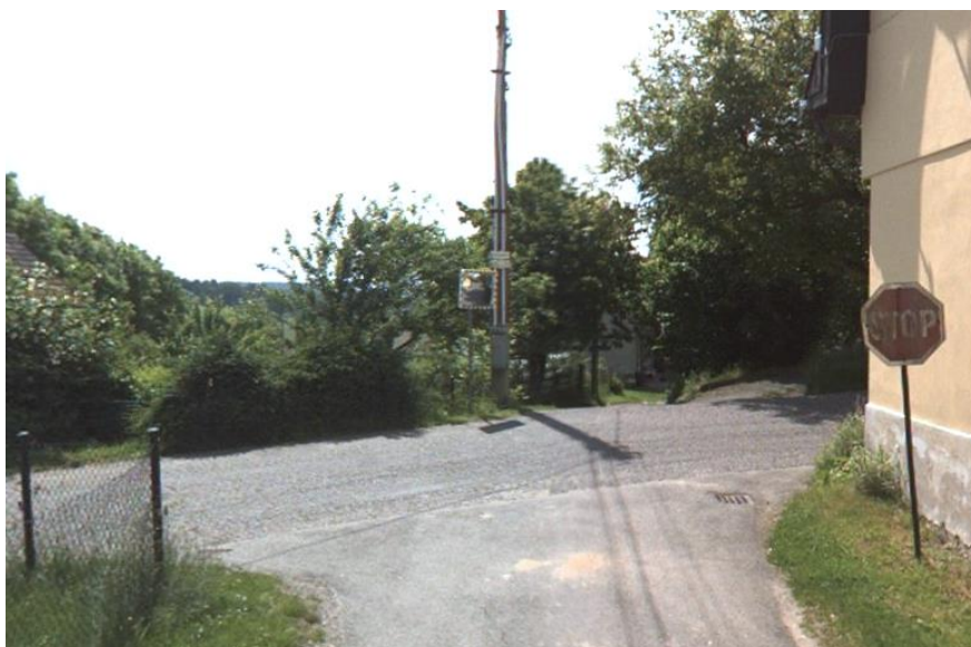
2. Nepřehledná křižovatka v Hrubém Lesnově (částečně vyřešeno zrcadlem)