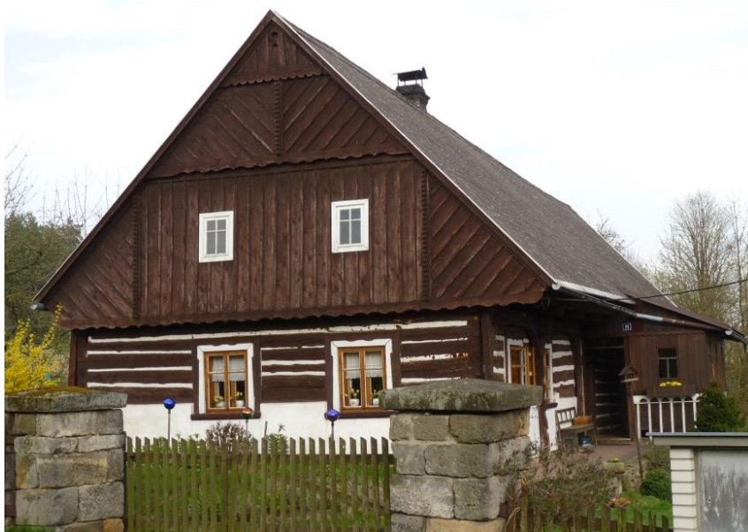
7. Poloroubený dům (č. p. 11)