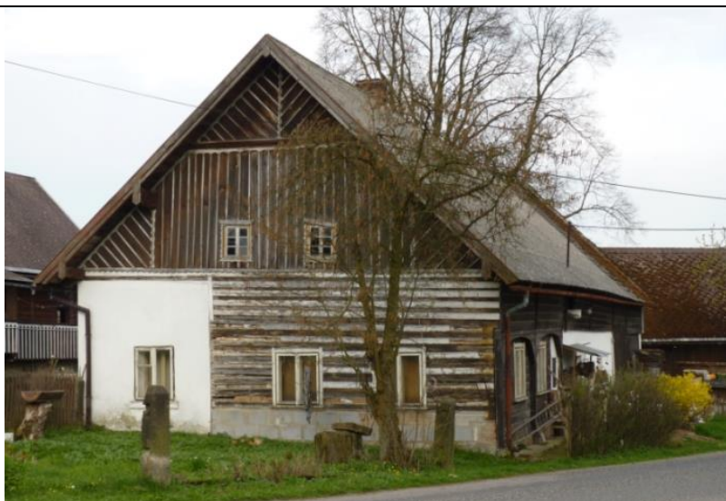
6. Poloroubený dům v lokalitě Hrubý Lesnov (č. p. 39)