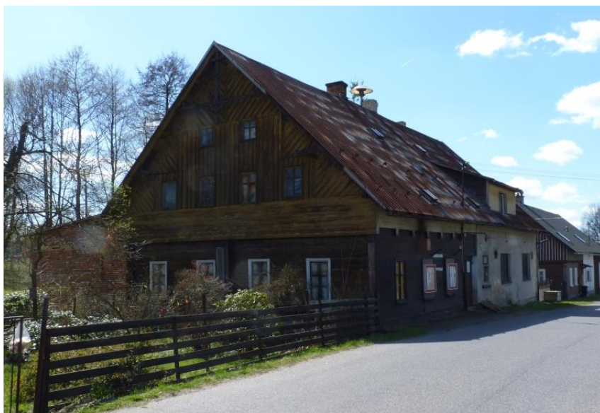
1. poloroubený dům lidové architektury se sedlovou střechou (č. p. 58)