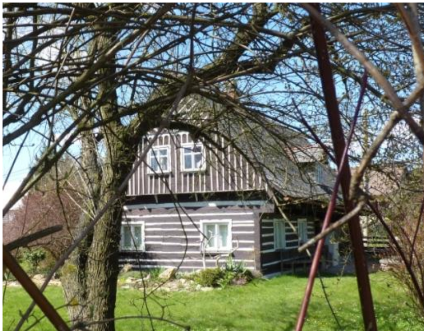
4. roubený dům se sedlovou střechou (č. p. 61)