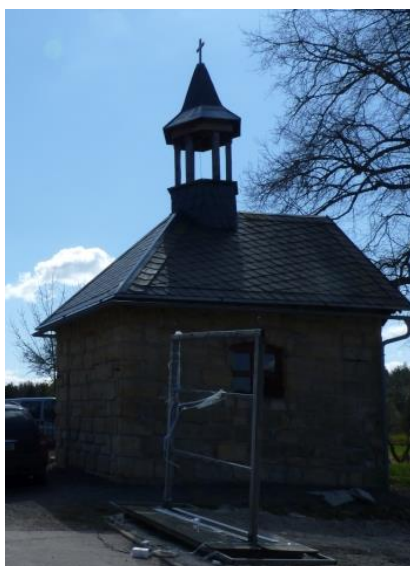
5. Kaplička z roku 1796 – opravena v roce 2005 (vedle č. p. 15)