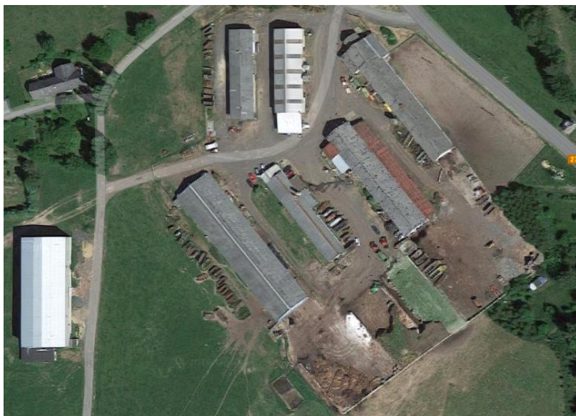
2. Agrokomplet Janův Důl – předimenzovaný zemědělský objekt (nejkvalitnější půda)