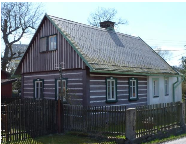
3. poloroubený dům se sedlovou střechou (č. p. 74)