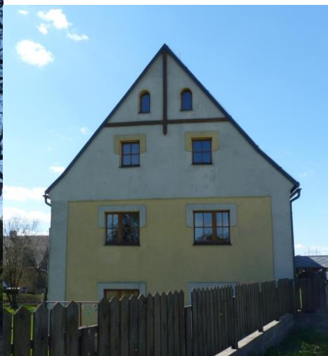
6. Zděný venkovský dům (č. p. 10)