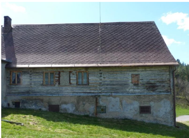
1. Špatný stav budovy statku