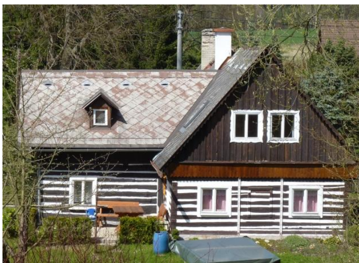
7. roubený dům se sedlovou střechou (č. p. 60)