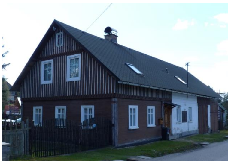
2. poloroubený dům lidové architektury se sedlovou střechou (č. p. 62)