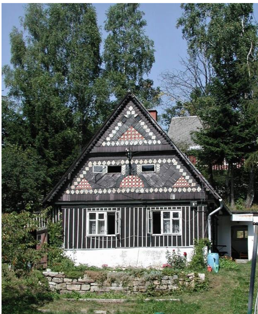
2. Dům lidové architektury s břidlicovým deštěním ve štítu (č. p. 95)