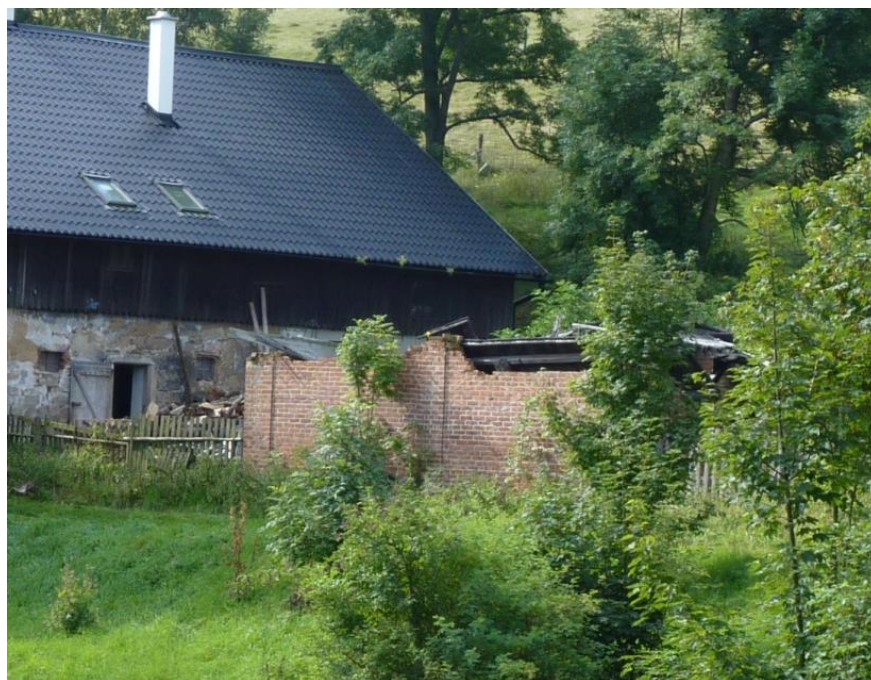
1. Zbořeniště v Jeřmanicích