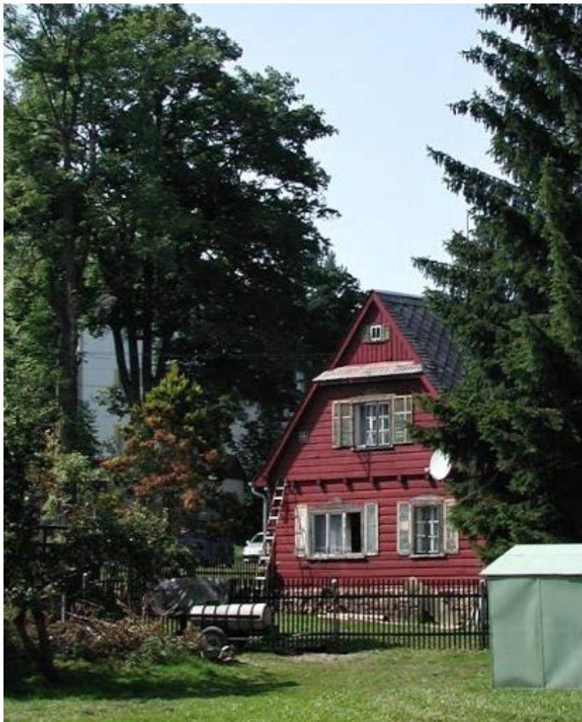
3. Roubená chalupa (č. p. 282)