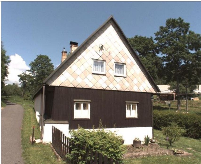
5. Dům lidové architektury (č. p. 195)