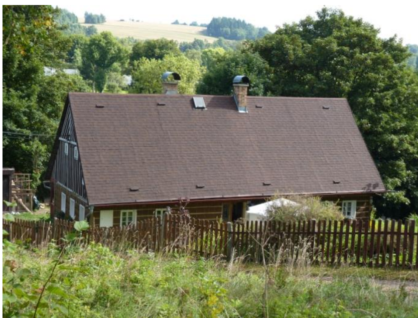
4. Roubená chalupa (č. p. 17)